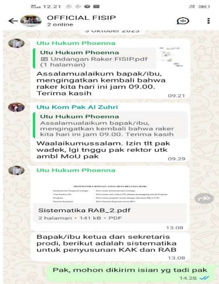
Koordinasi pengisian RAB dan KAK

FISIP UTU melaksanakan pertemuan rutin bersama dengan seluruh jajaran pimpinan Prodi lingkup FISIP pada bulan Oktober 2024 untuk membahas rencana program dan alokasi anggaran yang diperlukan untuk 2025 dan 2026. Sedangkan pelaporan yang dilakukan disebut dengan pelaporan kinerja atau LAKIN yang dibuat setiap tahun oleh FISIP UTU. LAKIN dapat diakses pada webstie FISIP yaitu https://utu.ac.id/fisip/