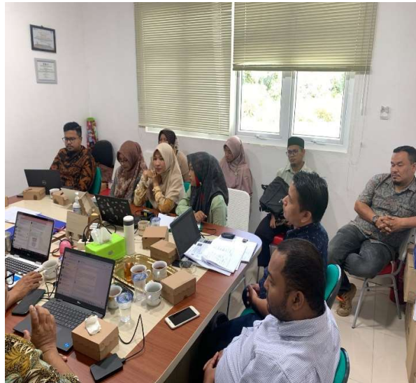
Rapat Pembahasan RAB Program Prodi Lingkup FISIP